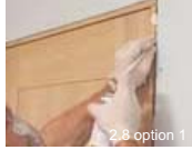
2.8 option 1

Option 2: Fixez le cadre avec des vis à distance. (Conseillé pour les portes lourdes): Forez des trous dans la rainure du listel au niveau des charnières, au niveau de la serrure et 20 cm du bas. Serrez les vis à distance avec tampon pour fixer l'ébrasement. Appliquez une quantité limitée de mousse de montage entre le mur et le chambranle.