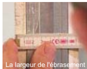
La largeur de l'ébrasement