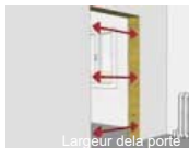
Largeur de la porte